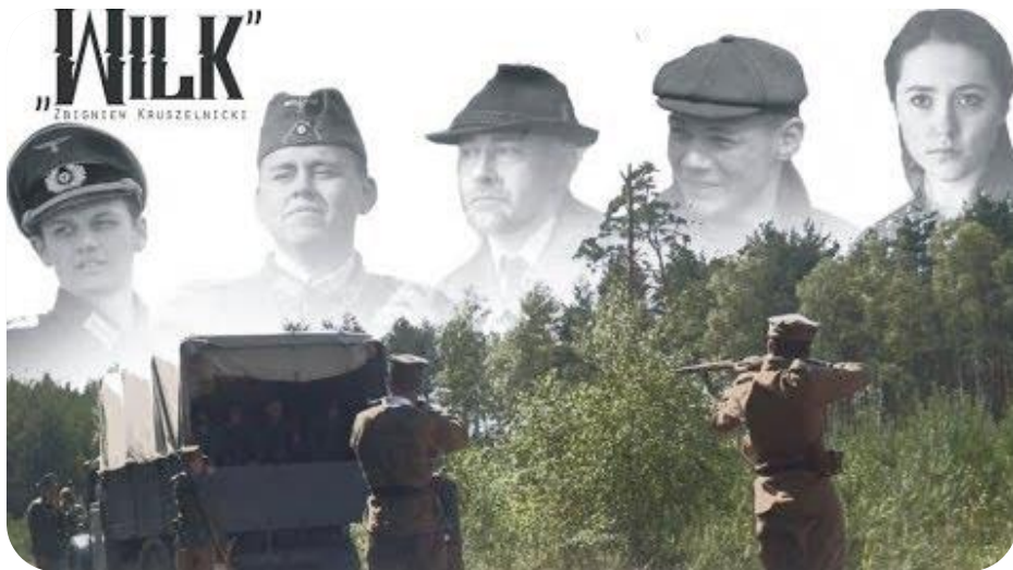
O Zbigniewie Kruszelnickim „Wilku” nakręcono film.