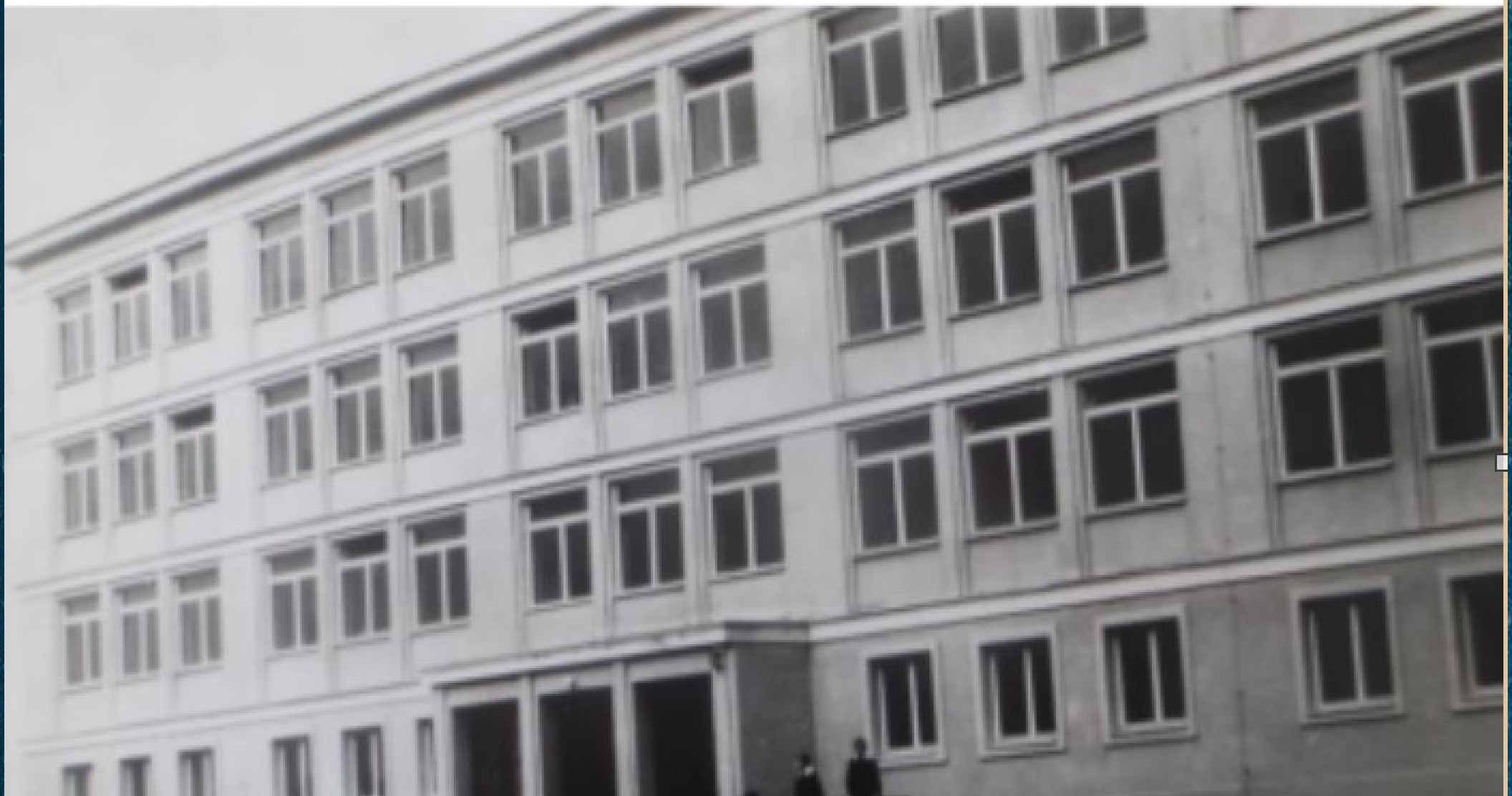
Fot. 5. Szkoła Podstawowa nr 18 w Kielcach, 1964 r.

Wzrostowa nr 18 w Kielcach rozpoczęła działalność stała na rozbudowującym się osiedlu Czarnów p robrego. Od początku była ważnym miejscem na dla lojalnej społeczności.